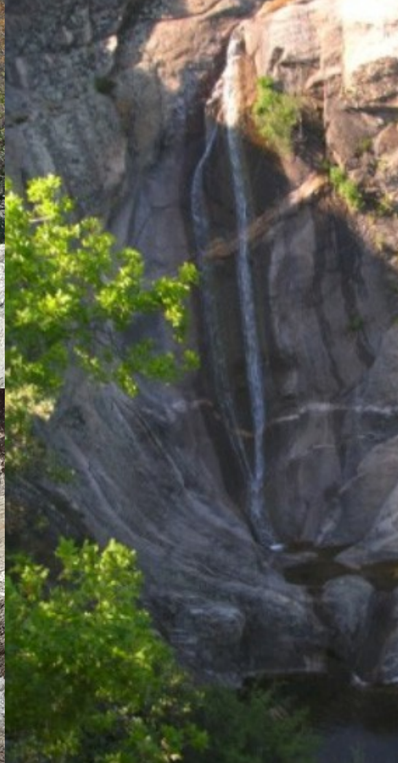
Cascade d'Albine : vue en été de loin dans toute sa hauteur