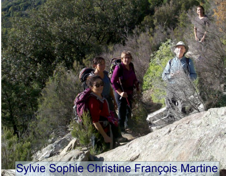
Sylvie Sophie Christine François Martine

St Martin de l'Arçon, col de Pomarède, cascade d'Albine, cabanes de Caylus, sentier de Peyre Grosse, table d'orientation, chemin des Gardes, St Martin de l'Arçon